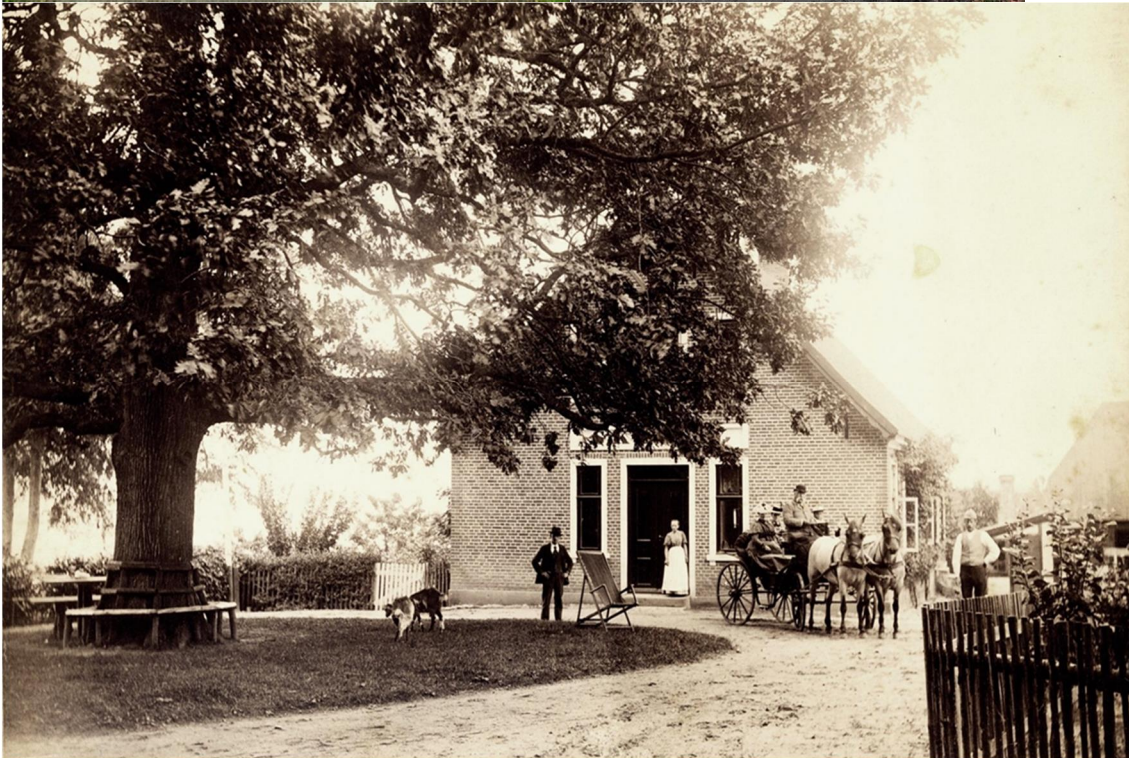
Skovly ca. år 1900